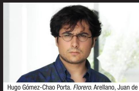
Hugo Gómez-Chao Porta. Florero . Arellano, Juan de