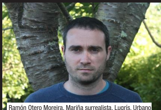
Ramón Otero Moreira. Mariña surrealista . Lugrís, Urbano