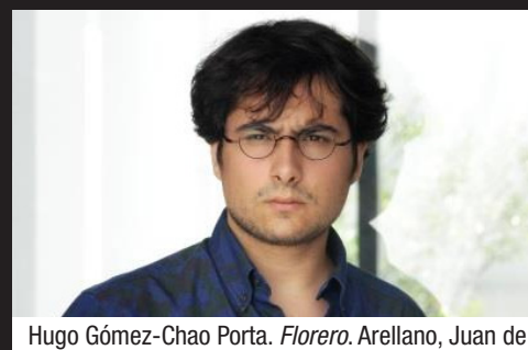
Hugo Gómez-Chao Porta. Florero . Arellano, Juan de